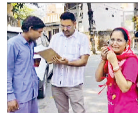
मृतक के परिजन विलाप करते।

भाई की हत्या लड़की के मामले को लेकर की गई है। आरोप है कि लड़की के मामा के परिवार ने हत्याकांड को अंजाम दिया है।