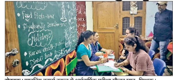
रोहतक। शाइनिंग स्टार्स स्कूल में अर्धवार्षिक परीक्षा मौजूद छात्र-शिक्षक।

शाइनिंग स्टार्स स्कूल में अर्धवार्षिक परीक्षा परिणाम घोषित किए गए, जिसमें विद्यार्थियों ने अपने अभिभावकों के साथ उत्साहपूर्वक भाग लिया। विद्यालय प्रांगण में परिणाम घोषणा के समय एक सौहार्दपूर्ण एवं उल्लासमय वातावरण रहा। बच्चों की मेहनत, लगन और नियमित अध्ययन का परिणाम उनके उत्कृष्ट प्रदर्शन में स्पष्ट दिखाई दिया। परिणाम देखकर विद्यार्थियों और अभिभावकों के चेहरों पर संतोष और प्रसन्नता झलक उठी।