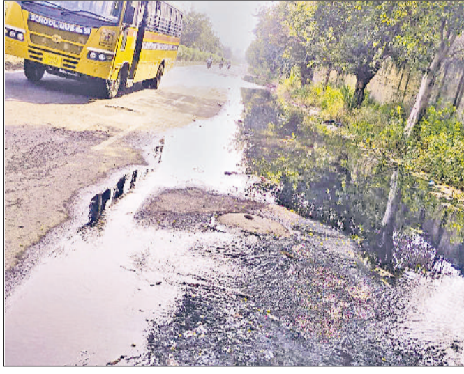
रोहतक। गांव बोहर में सड़क पर जमा गंदा पानी।