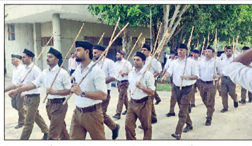
रोहतक। राष्ट्रीय स्वयंसेवक संघ अपने स्थापना शताब्दी वर्ष कार्यक्रम में भाग लेते राष्ट्रीय स्वयंसेवक।