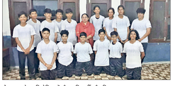
रोहतक। खेल प्रतियोगिता में मौजूद विद्यार्थी और शिक्षक।

3 से 5 अक्टूबर तक शिक्षा विभाग हरियाणा द्वारा आयोजित 58वीं हरियाणा राज्य स्तरीय स्कुली प्रतियोगिता में रोहतक जिले की छात्राओं ने उत्कृष्ट प्रदर्शन कर जिले का नाम रोशन किया। प्रतियोगिता में रोहतक की छात्राओं ने कराटे और क्रिकेट दोनों खेलों में शानदार प्रदर्शन किया। मीडिया संयोजक डॉक्टर जनक राज