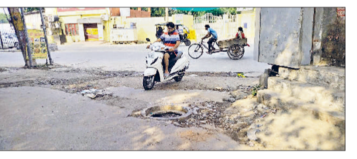
रोहतक। गांव बोहर में सड़क पर जमा गंदा पानी।

एमडीएन स्कूल के पास मुख्य सड़क पर सीवर व्यवस्था का बुरा हाल है। कहीं सीवर जाम हैं तो कहीं सीवर मेनहॉल के ढक्कन ही गायब हैं। ऐसे में बड़ा हादसा होने का डर बना रहता है। स्थानीय लोगों ने प्रशासन से मांग की है कि सीवर व्यवस्था को सही करवाया जाए। लोगों का कहना है कि इसके अलावा कई और कॉलोनीयों में या तो सीवर के ढक्कन टूट चुके हैं या गायब हैं। जिनकी वजह से लोगों को काफी परेशानी हो रही है।