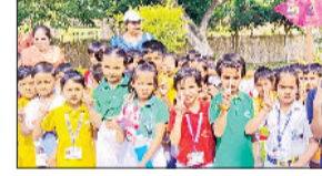
रोहतक विडियाघर का शैक्षिक भ्रमण करने पहुंचे मॉडल स्कूल महम के बच्चों ने।